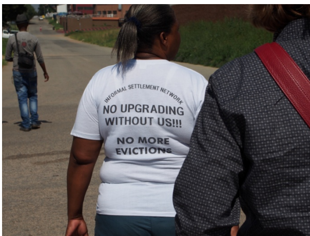
No Upgrading without us