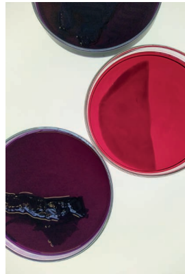
Colouring, 2024 Miriam Eichinger