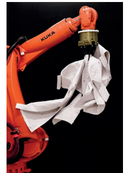
Folding Textile, 2017 Simon Hochleitner