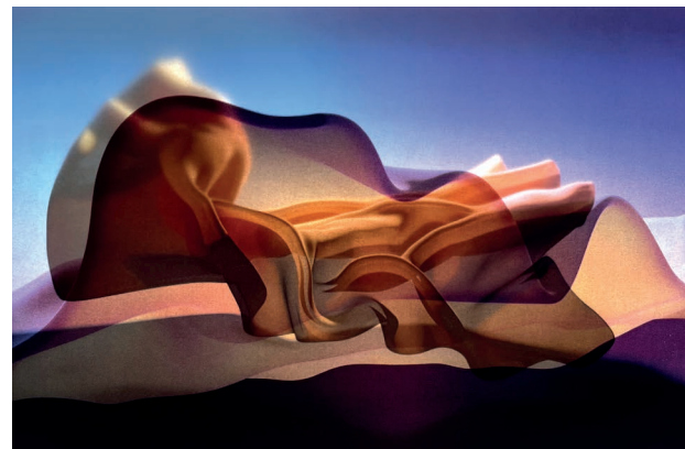
Culinary Turn, 2023 Sandra Axinte