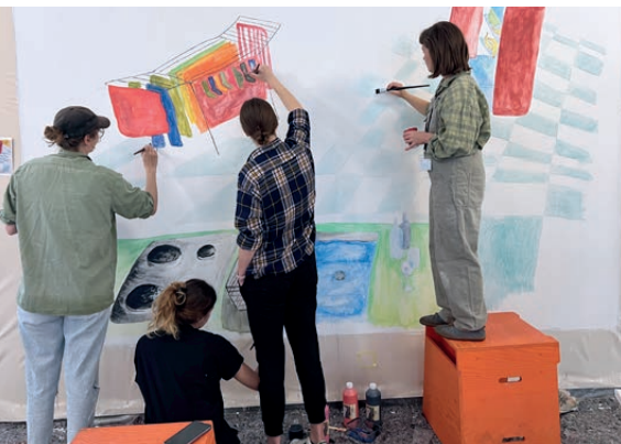
Gemeinschaftsmalerei Wintersemester 23/24

The interconnection of artistic practice and expert discourse produces new forms of expression and impulse for shaping society and the future together.