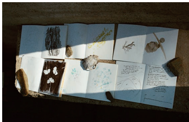
Kunst und Gestaltung, Master © Anna Pech