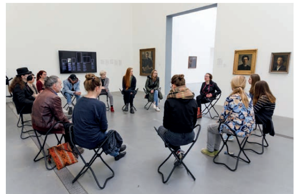
Kunstvermittlung an Originalen, Lentos