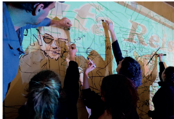
Von der Exkursion zur Manifesta in Pristina hin zur Ausstellung der Studierenden im space in Lmz