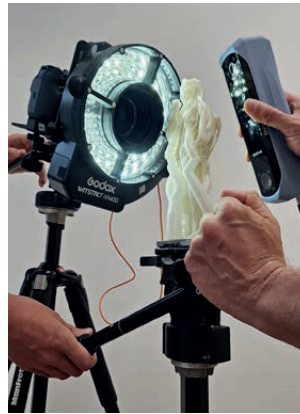
Digital und analog: 3D-Scan und Druck

The teacher education programme in Media Design and Digital Literacy enables cross-media experimentation and interweaves artistic practice with critical reflection.