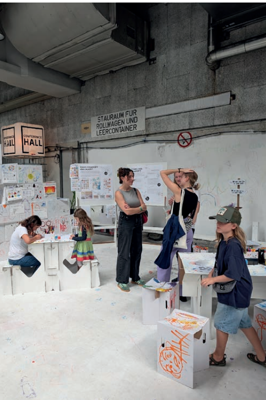
Das Kreativstudio 2030 zum Ars Electronica Festival 2025