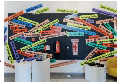
Kreatives Chaos zu Künstlicher Intelligenz